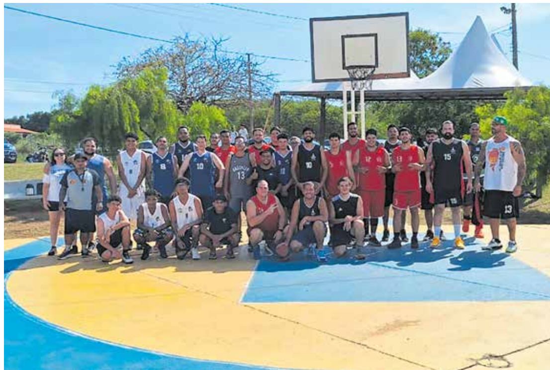
O evento promoveu a modalidade do basquete que consiste na disputa em apenas um dos lados da quadra tradicional do esporte

A Orla de Presidente Epitácio conta com três quadras de Streetball para uso da população, além de pista de skate, areninha de futebol society, quadras de areia, ciclofaixa, pista para caminhada e ampla área para prática esportiva e lazer gratuito.