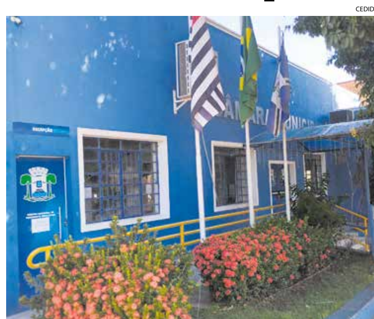
Câmara Municipal de Presidente Epitácio