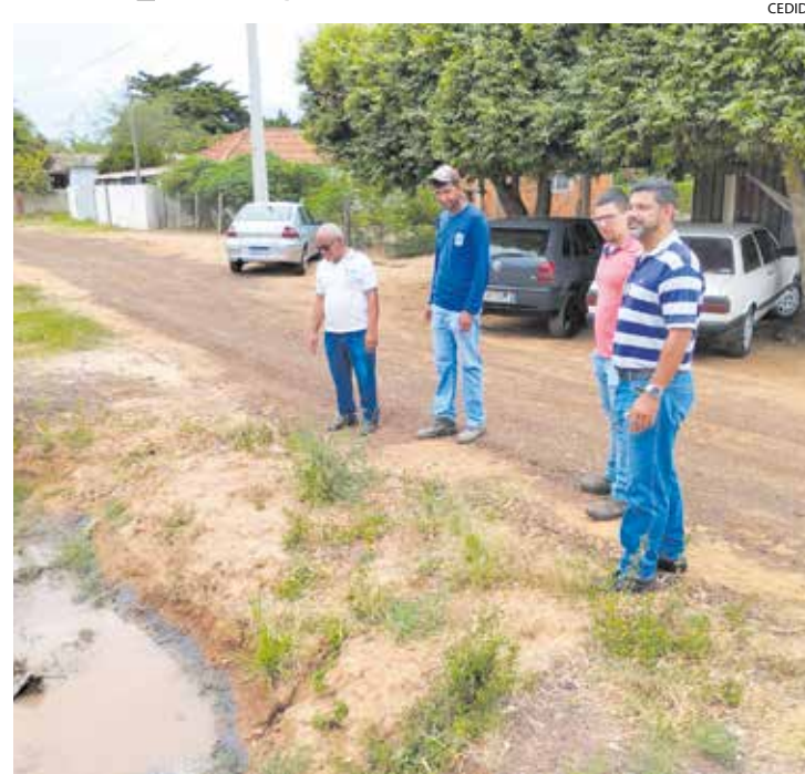
De acordo com a Sabesp, companhia responsável pelo saneamento básico e abastecimento, as vias foram lavadas com uma solução de água e hipoclorito de sódio

A Prefeitura de Presidente Epitácio realizou a vistoria da situação envolvendo o vazamento de um registro na unidade de tratamento de esgoto no distrito Campinal, na terça-feira, (02).