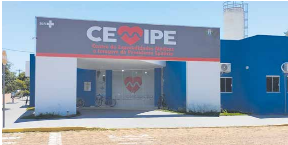
O mutirão tem como objetivo zerar as filas de consulta e de cirurgias de catarata e pterígio

“Apesar do município contar com a especialidade médica, o atendimento municipal de saúde não tem sido capaz de lidar com a demanda, assim como os hospitais públicos que deveriam realizar as cirurgias oftalmológicas também não conseguem. Diante disso, a Prefeitura de Epitácio, através da Secretaria de Saúde, decidiu contratar uma empresa especializada para realizar entre os meses de Janeiro e Fevereiro todas as consultas