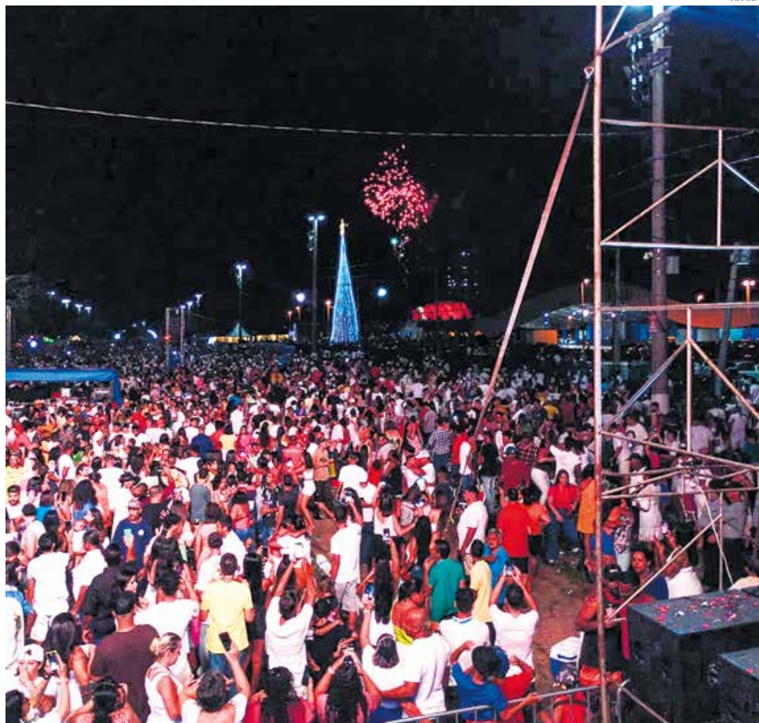
Com entrada franca e estacionamento gratuito, o público usufruiu da estrutura que contou com quiosques, banheiros, equipe de apoio, segurança, Corpo de Bombeiros, Polícia Militar

O Departamento de Trânsito Municipal montou um esquema especial de interdição do tráfego de veículos na área destinada ao público, portanto o acesso de carros foi totalmente bloqueado no trecho da Av. Marginal entre