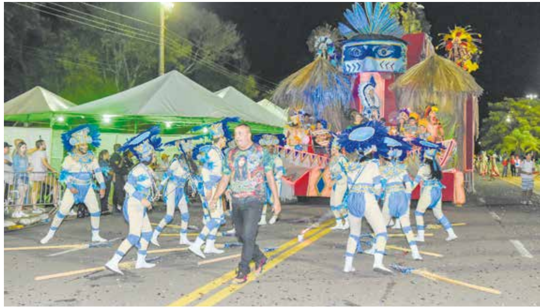
A primeira parcela do contrato, no valor de R$60 mil, foi repassada no último dia 02 de janeiro

O desfile das escolas de samba no Carnaval 2024 está previsto para ocorrer dia 10 de fevereiro (sábado), e a segunda apresentação deve ocorrer no dia 12 de fevereiro (segunda-