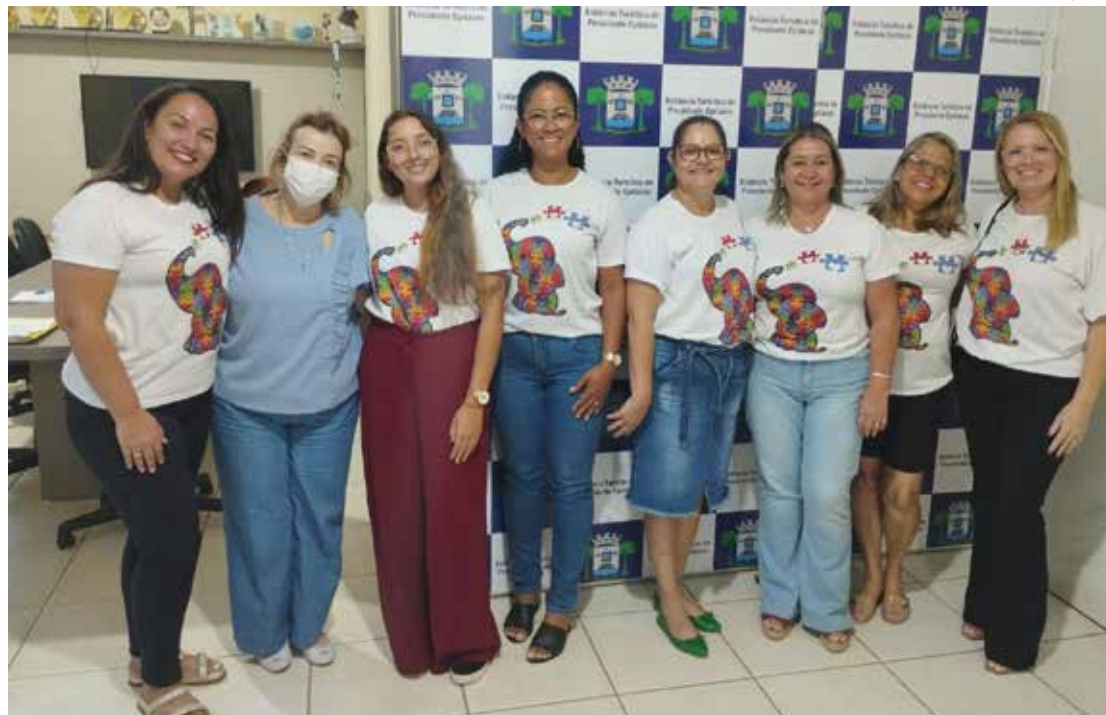
A reunião possibilitou reforçar a importância do trabalho colaborativo da equipe escolar

A reunião possibilitou reforçar a importância do trabalho colaborativo da equipe escolar, do transporte, dos PAE (Profissionais de Apoio Escolar), estagiários, professores auxiliares, ADI (Auxiliar de Desenvolvimento Infantil), professores do AEE, além da parceria com a família.